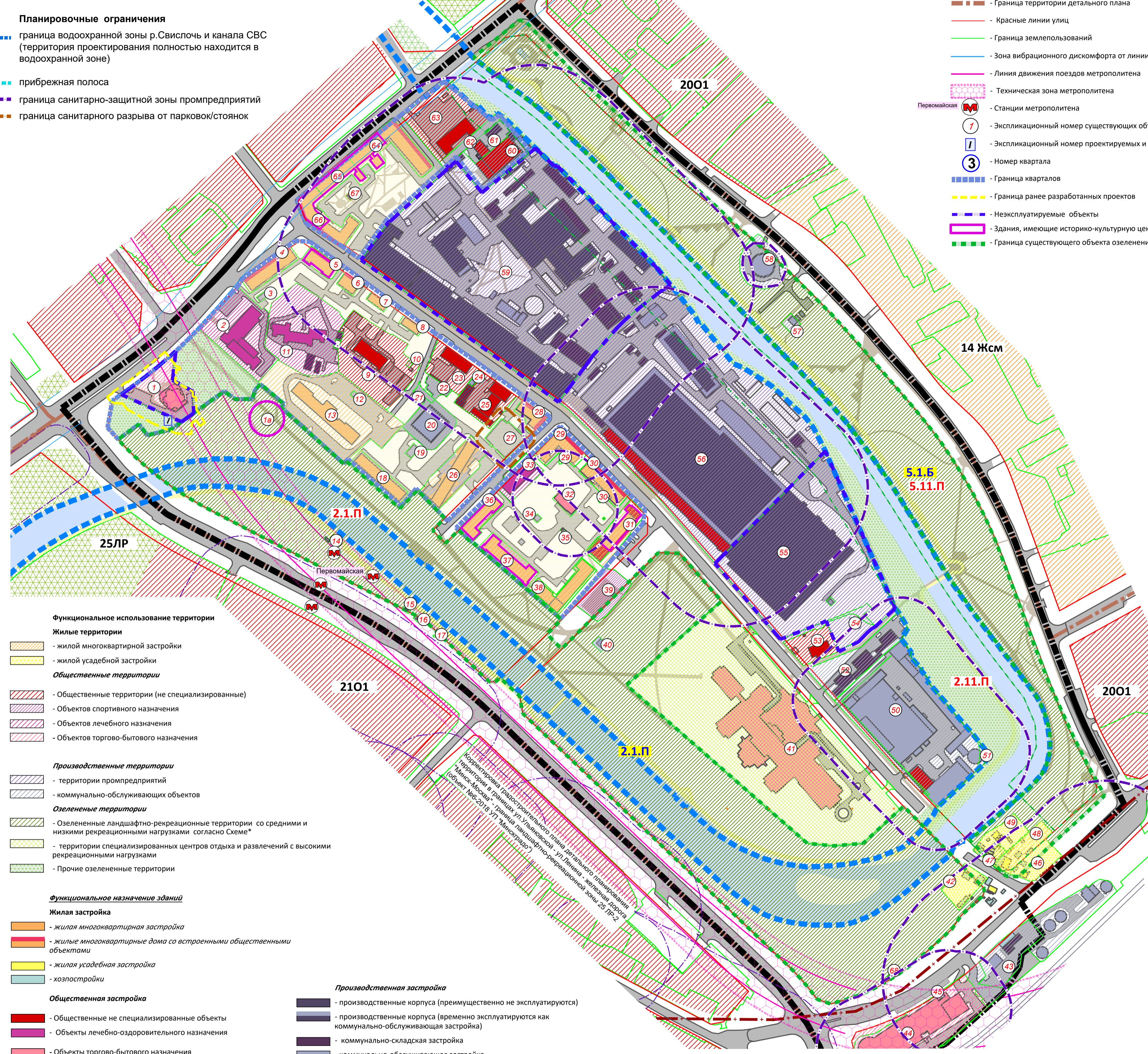
СХЕМА ДЕТАЛЬНОГО ПЛАНА