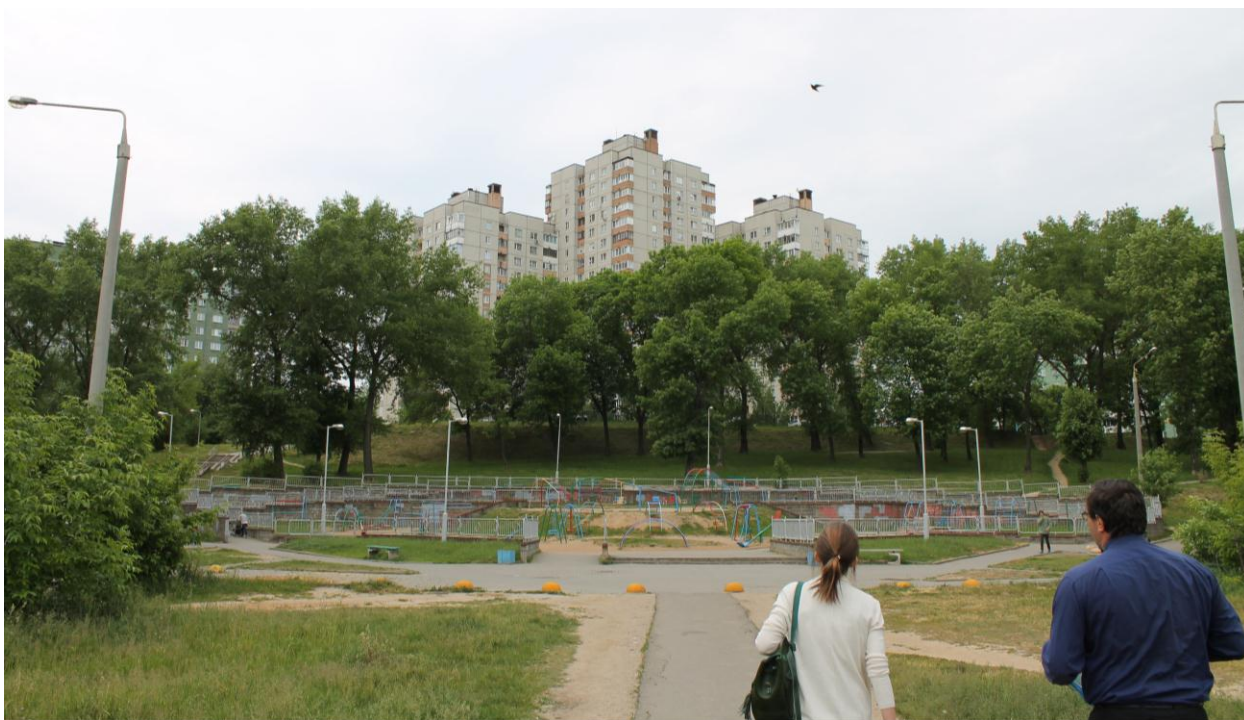
Рис. 3.2. Озеленение придомовой территории