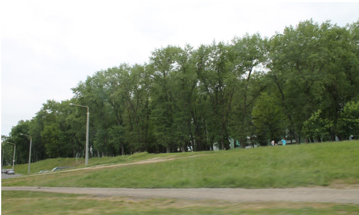
Рис. 3.1. Вид на озелененную территорию общего пользования вдоль пр. Рокоссовского

Состояние представителей животного мира оценивается как здоровое.