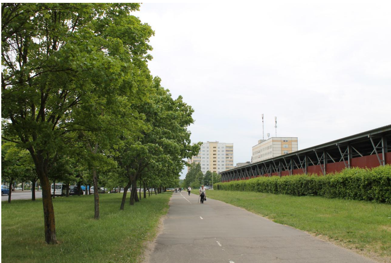
Рис. 3.3. Озеление вдоль улицы Плеханова (возле паркинга)

Таким образом, состояние окружающей среды территории в целом благоприятное для проживания населения и природного окружения.